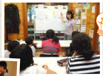
お金の使い方を学ぶ子どもたち (一社)凸凹Kidsすべいす♪