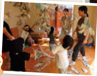
新聞紙を使って遊ぶ子どもたち NPO法人にじのこ